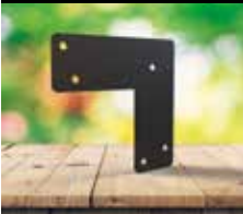
Escuadra en L