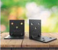
Escuadra de unión