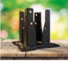
Pie de pilar cuadrado