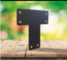
Escuadra plana en T