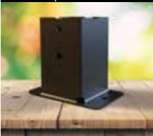
Pie de pilar cuadrado