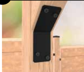
8 Escuadra de unión de 135°