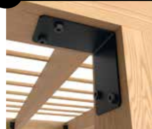
8 Escuadra de unión de 135°